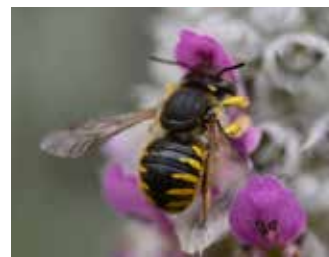
Storullbi på lammöra.