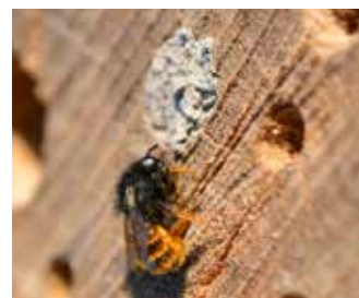
Rödmurarbi vid sitt bo.

Rapportera ditt vildbihotell på www.bivanlig.nu , dela gärna bilder i sociala medier med #bivanlig